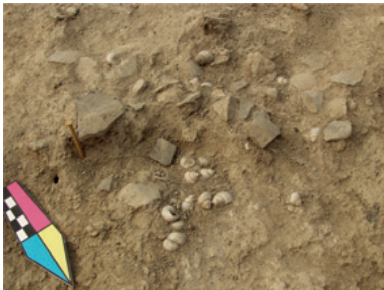
Slika 2. Nagomilanje ljuštura roda Viviparus sp. u kvadratu C IV 3.

(sl. 1–5a, b). Osim pojedinačnih primeraka, koji se nalaze rasuti na istraženoj površini bez neke određene pravilnosti, u kvadratu C IV/3, u lokusima 13 i 14 otkriveno je nagomilanje ljuštura roda Viviparus (sl. 2). Na istom mestu nalazilo se dosta fragmenata keramike.