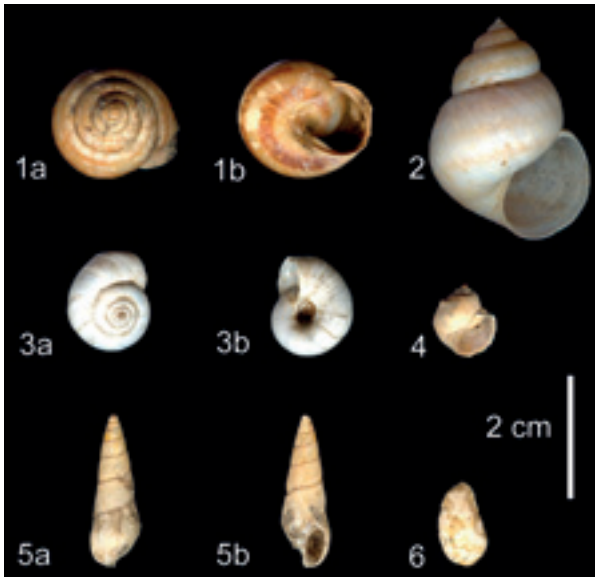
Slika 1. Kopneni puževi i slatkovodni puževi i školjke na nalazištu Vinča – Belo Brdo (iskopavanja 1998–2003):

Kopneni puževi su retki: sakupljeno je 10 ljuštura roda Helix , 11 ljuštura roda Cepaea (sl. 1–1a, b), 4 roda Helicella (sl. 1–3a, b), 3 roda Helicigona i 3 roda Trichia . Ljuštura su dobro očuvane, a činjenica da su mnoge polomljene jeste posledica fragilnosti ljuštura i oštećenja nastalih tokom iskopavanja i skladištenja. Na ljušturama roda Cepaea očuvana je boja. Na većini sakupljenih ljuštura puževa spoljašnja površina nije oštećena, niti se uočavaju neka druga oštećenja koja bi ukazivala na manipulaciju od strane čoveka.