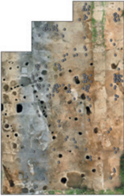
Slika 5. Distribucija školjaka na površini istraženoj u kampanjama 1998, 1999. i 2001. godine (digitalizacija Anja Subotić).

termičke obrade. Slično je i na nalazištu Ecsegfalva 23, a autori studije o školjkama sa tog nalazišta pretpostavljaju da su školjke konzumirane sirove, kao što se uobičajeno koriste ostrige (Gulyás et al. 2007). Moguće je i da su bile kratko kuvane, te da kratko izlaganje temperaturi nije dovelo do pucanja ljuštura i njihove promene boje. Tadić (1961) opisuje način na koji se školjke pripremaju za jelo. Meki deo tela se vadi tako što se životinja prvo ubije kuvanjem u vodi, a zatim se kroz zadnji deo ljušture uvuče nož, pa se njim preseče zadnji mišić zatvarač, otvore kapci i preseče prednji mišić zatvarač, a onda se meko telo lako odvaja od ljušture.