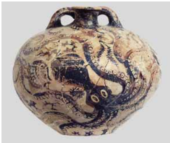
сл. 3. „Ваза с хоботницом“ из Гурније (Permission is granted to copy, distribute and/or modify this document under the terms of the GNU Free Documentation License)