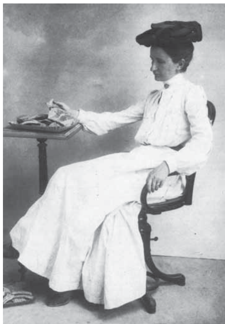
сл. 1. Херијет Бојд Хоз с минојском керамиком, 1902.

Да ли у историји археолошких Дидеја, па и у археолошком часопису има места за текст о друштвеној, политичкој, историјској, па и моралној улози неког археолога (или археолошкиње), уместо о „открићима“, ма колико сензационална она била? Студија случаја, која је изнета у овом раду, може бити добар повод за размишљање на ту тему, а има за циљ да осветли археолошко и друштвено дело америчке археолошкиње Херијет Бојд Хоз (Harriet Boyd Hawes) (сл. 1). 1 Рођена је 1871. у Бостону, а 1888. се уписује на чувени Смит колеџ (Smith College) у Масачусетсу где се, на незадовољство школе, ангажује у борби за права радника. Постаје опчињена археологијом под утицајем Амелије Едвардс (Amelia Edwards), списатељице и египтолога. По завршеном колеџу ради као учитељица и штеди за пут у Грчку, а 1895. креће у Атину, да студира у чувеној Британској (археолошкој) школи (British School at Athens). У возу на линији Париз-Марсеј случајно упознаје јетрву познате глумице Саре Бернар, која живи у Атини и која јој отвара врата грчког угледног друштва. Херијет одмах скандализује Атињане возећи бицикл, што се сматрало неприкладним понашањем за жене. Вредно студира, посећује предавања чувеног археолога Вилхелма Дерпфелда (Wilhelm Dörpfeld), Шлимановог сарадника и истраживача Троје и Олимпије, путује у Делфе и другде по Грчкој.