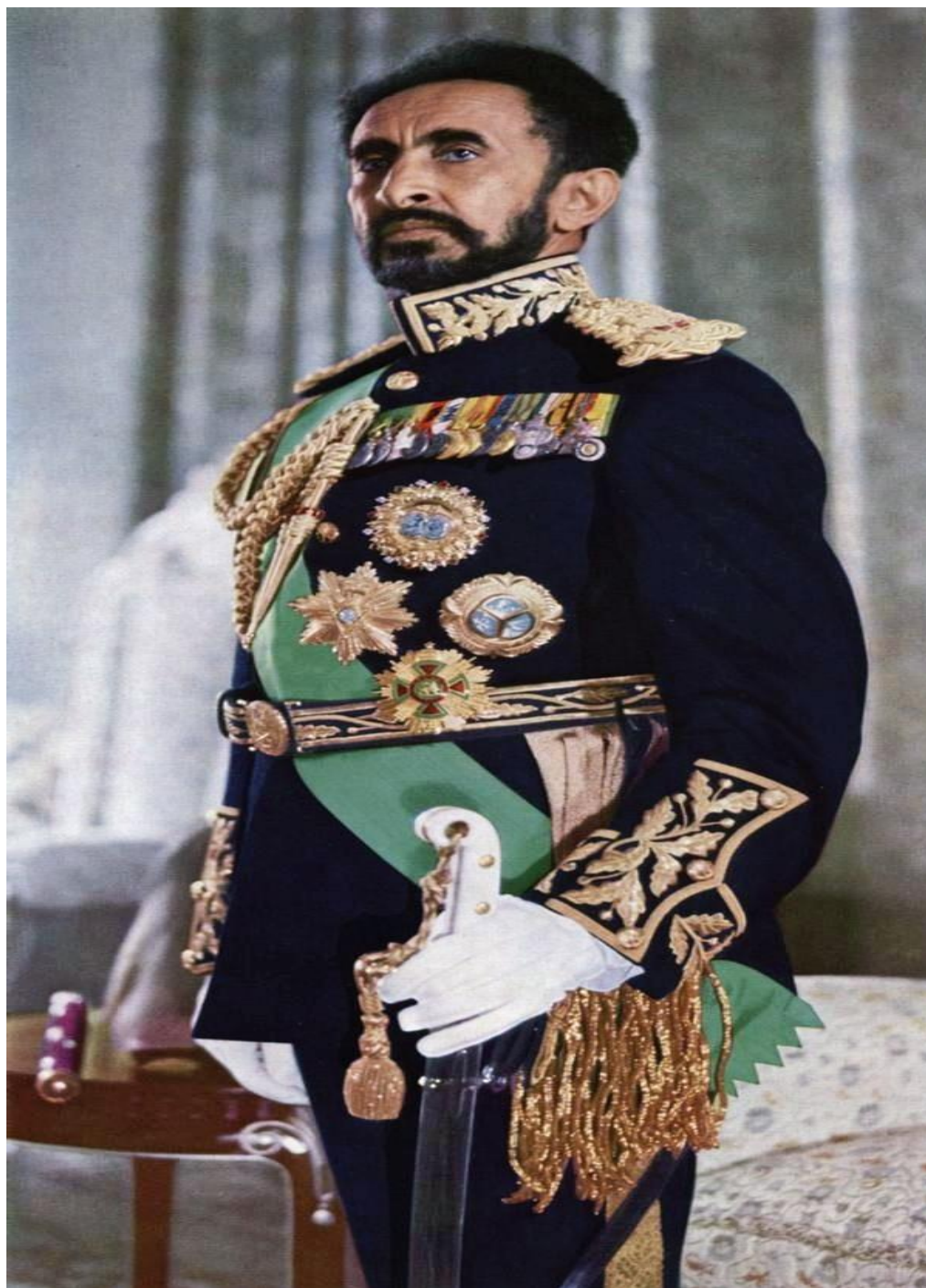
Хаиле Селасије, Цар Етиопије