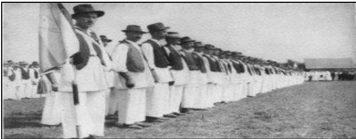
Слика 4.4. Хрватска Сељачка заштита

(војна/милицијска формација Хрватске сељачке странке; фотографија снимљена током 1930-тих, највероватније 1932)