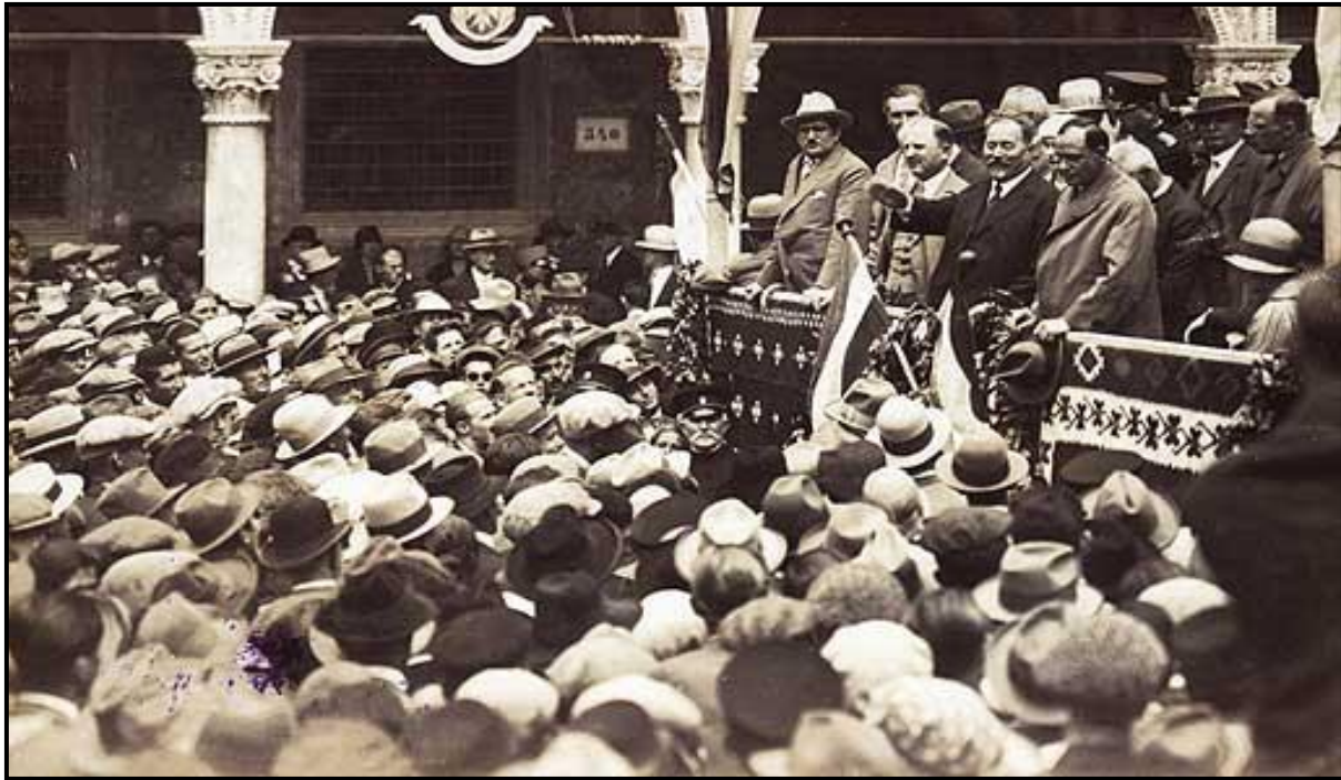
Слика 1.4. Стјепан Радић говори у Дубровнику 27. маја 1928

(лево од Радића је Светозар Прибићевић, један од његових сарадника у вођству СДК-а; фотографија из 1928)