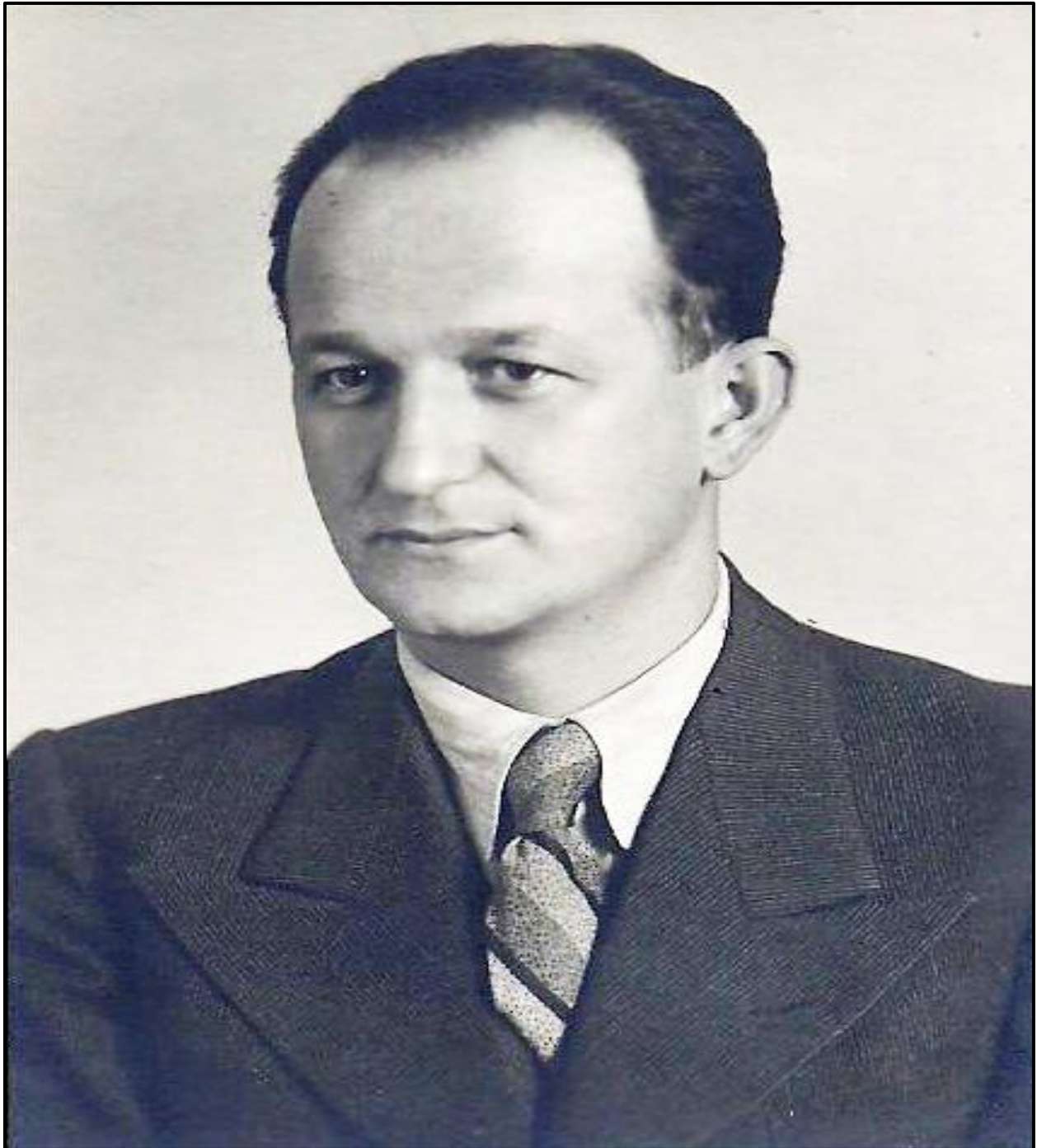
Слика 1.1. Михаило Константиновић, истакнут југословенски правник и политичар (1897-1982)