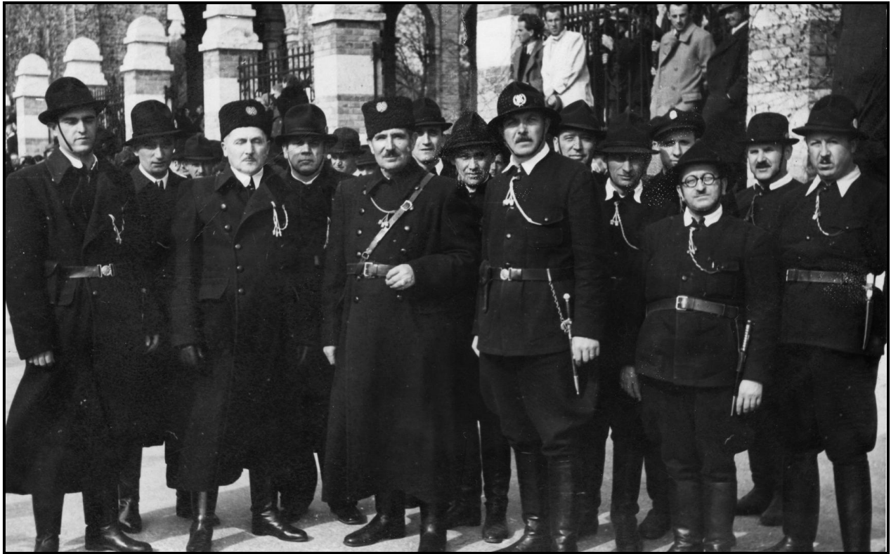
Слика 4.3. HGZ/Хрватска Грађанска стража у Загребу