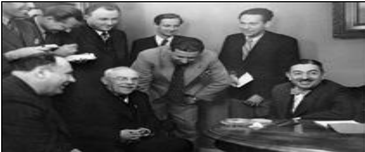
Слика 2.3. Учесници споразума (26. августа 1939): Влатко Мачек, Михаило Константиновић, Драгиша Цветковић

(фотографија направљена после коначног склапања споразума, 1939)