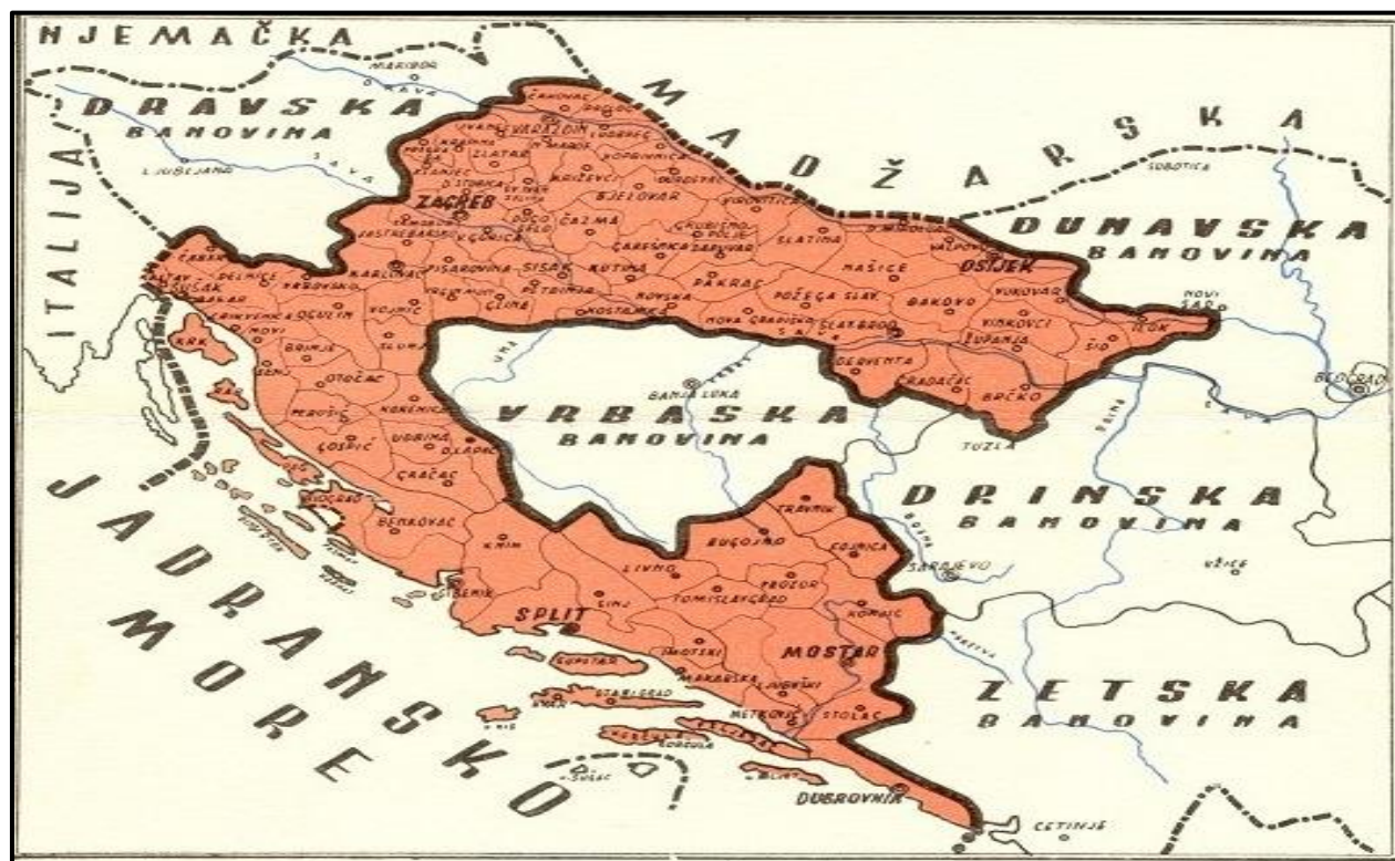
Слика 1.2. Срезови/котари Бановине Хрватске