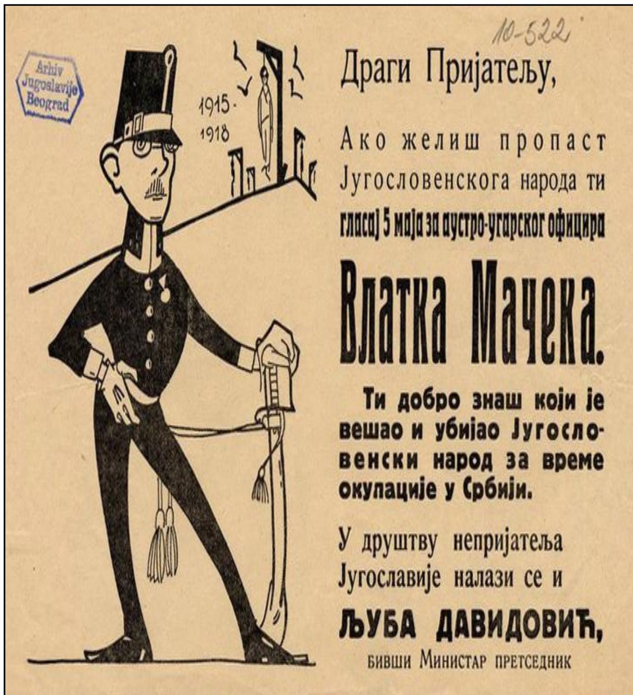
Слика 1.7. Пропагандни летак владине листе (петوماјски избори 1935.)

(Алузија на контроверзно хрватско учешће у Првом светском рату; данас у Архиву Југославије)