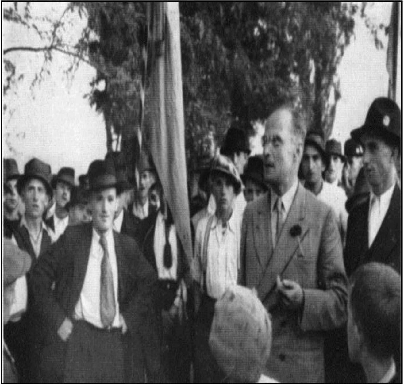
Слика 4.2. вођство ХСС (Јурај Крњевић) у агитацији међу пучанством Хрватске

(на слици одмах се види (модна) разлика између (грађанског) вођства ХСС и његовог већински сељачког изборног тела; фотографија настала 1938)