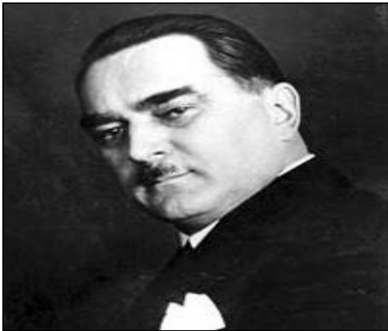
Слика 4.1. Милан Стојадиновић

На жалост, идеја о Српској земљи (као и пројекат Словеначке бановине и одређене уредбе у вези Бановине Хрватске) остала је реално мртво слово на папиру, услед заострених односа у Југославији и спољнополитичких неприлика.