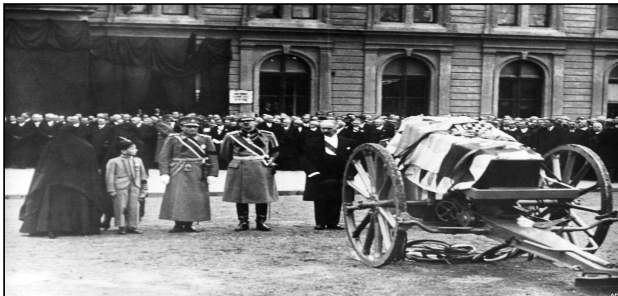
Слика 1.6. Погреб убијеног југословенског краља Александра Карађорђевића у Београду, после Марсељског атентата

(већ тада су почеле антисрпске демонстрације у Загребу; фотографија из августа 1928)