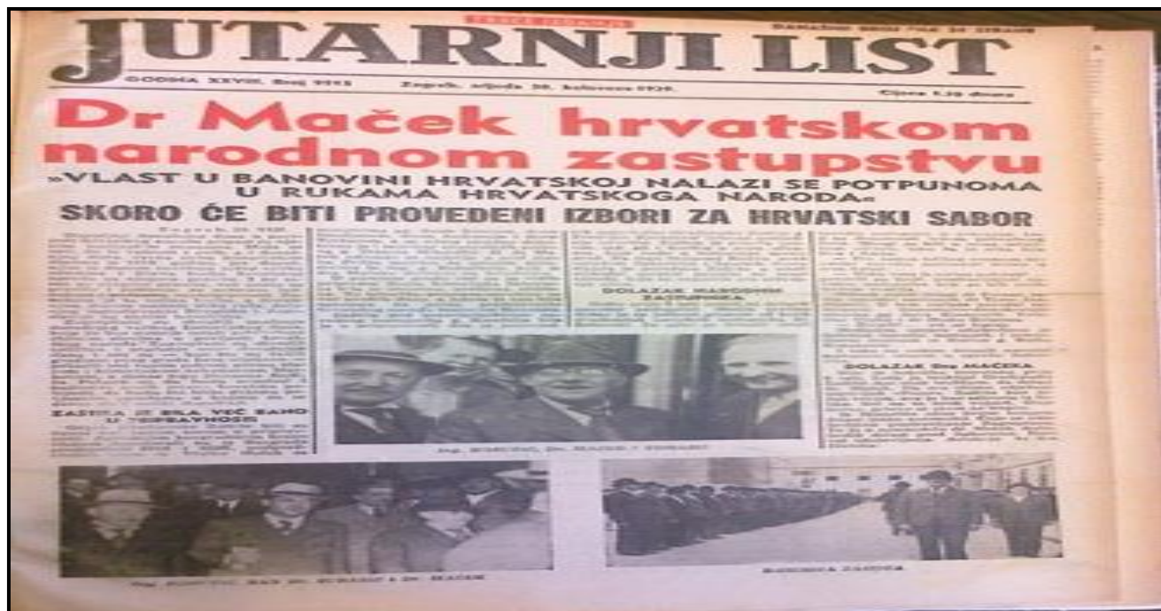
Слика 2.4. Хрватске новине о Мачековом потписивању Споразума

(фотографија направљена после коначног склапања споразума, 1939)