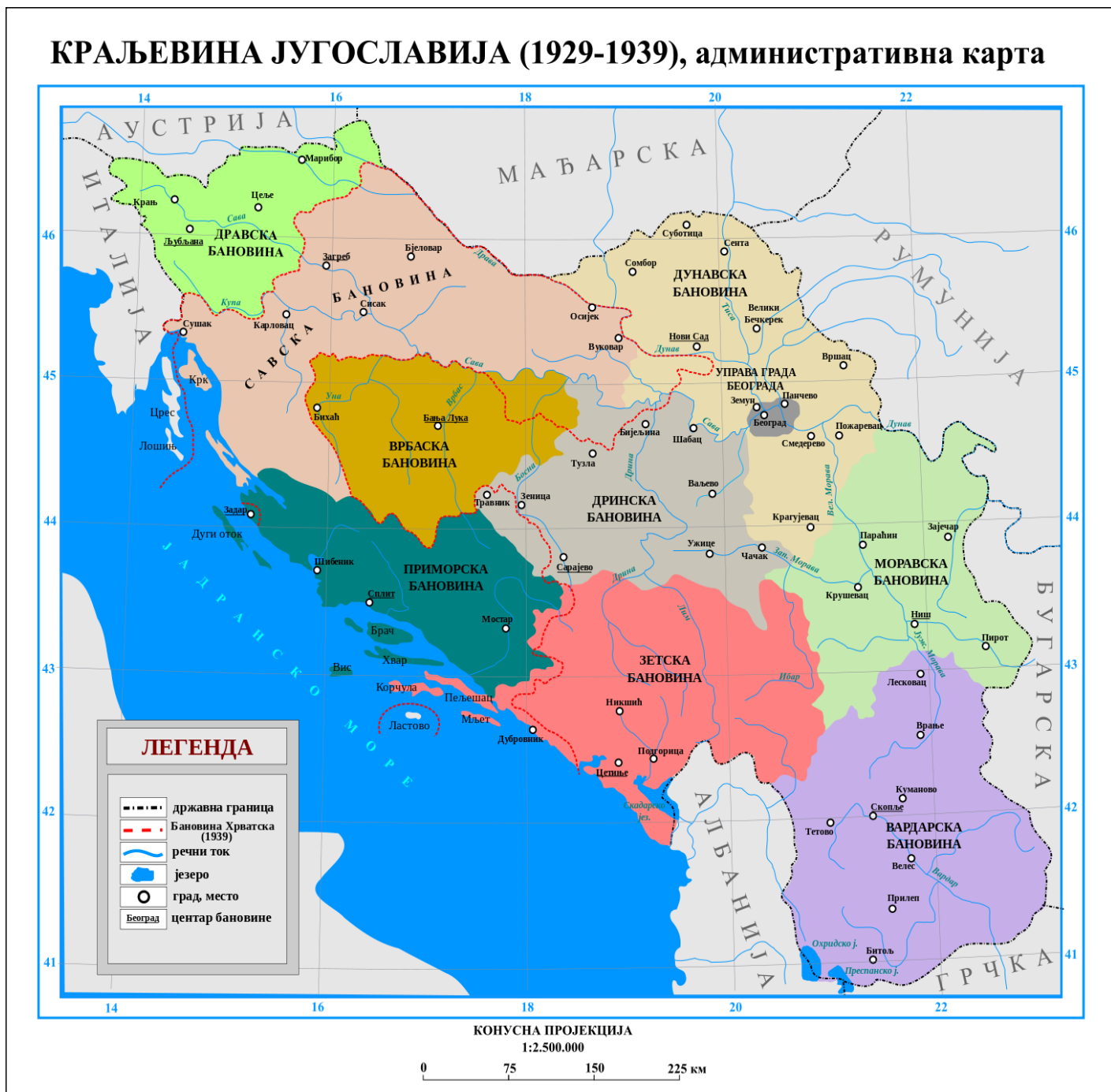
Слика 1.3. Унутарња подела Краљевине Југославије (1931-1939)