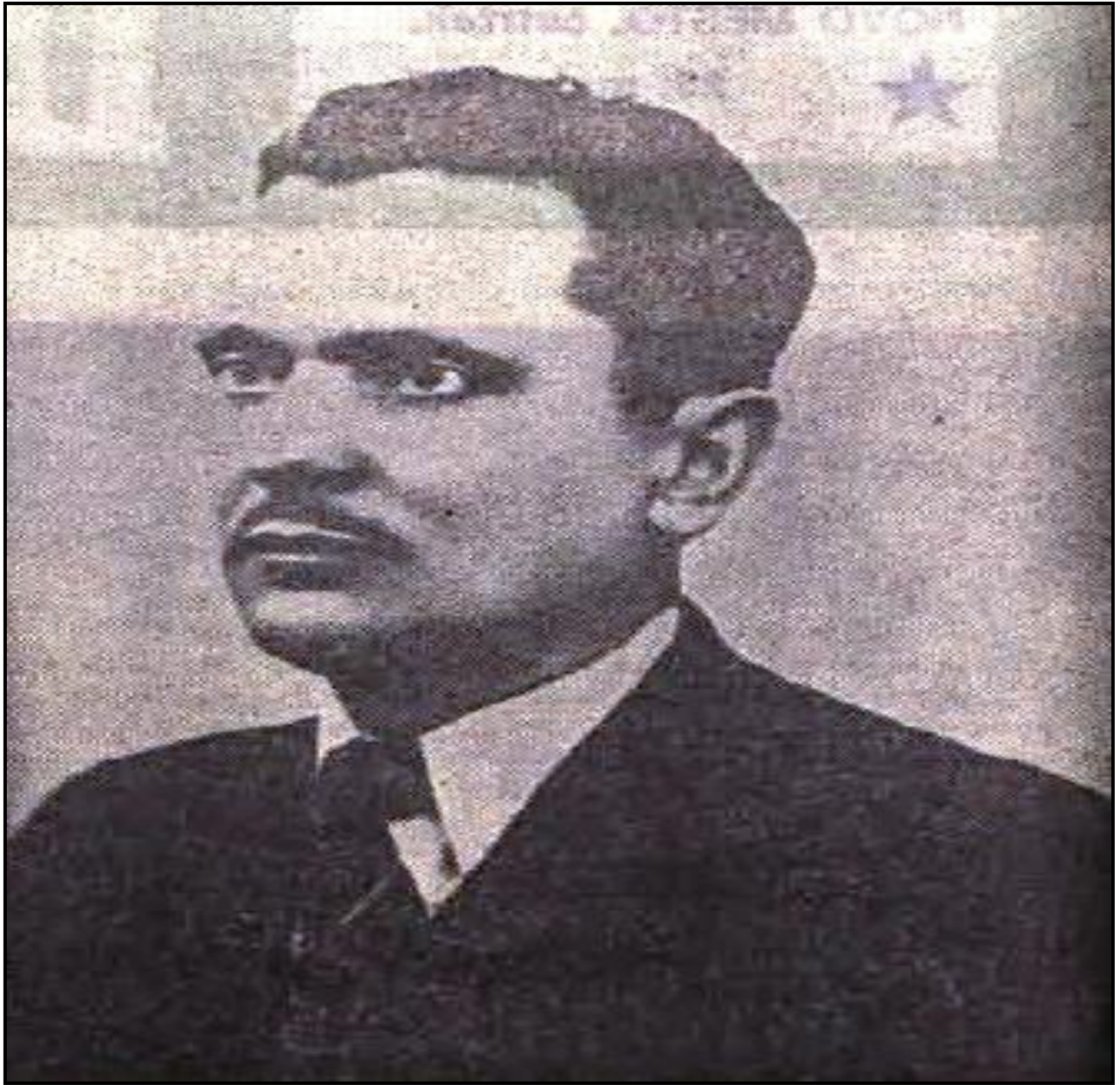
Слика 5.2. Јосип Броз Тито, генсек КПЈ (1937-1980)

(фотографија из лажне личне карте, 1939)