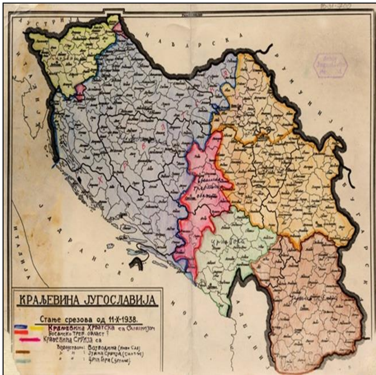
Слика 1.9. Мапа Мачекових претензија у вези територијалног опсега тражене Бановине Хрватске

(Направљена у Загребу 1938, ради представљања виђења ХССу вези опсега аутономне Хрватске; данас у Архиву Србије)