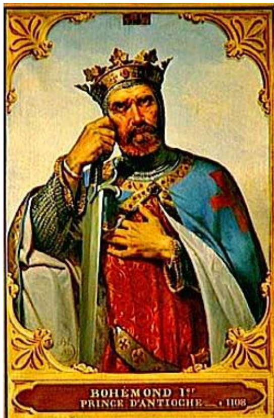
Слика 1. Боемунд Тарентски 40

Сви догађаји су били сасвим случајни. Боемунд је током једног септембарског дана посматрао велику норманску армију како пролази из северне Француске предвођена Робертом Нормандијским. Тој армији припадали су и Стефан од Блоа, који је био зет енглеског краља Виљема II и Иго од Вермоанда, који је био брат француском краљу Филипу. Они су оставили снажан утисак на Боемунда, у тој мери да он није имао оклевање да им се придружи. Током почетка похода Крсташа, Боемунд је имао око четрдесет година.