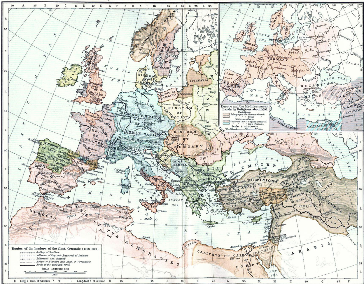
Слика 2. Путеви вођа Првог крсташког рата

Након што су све вође положиле заклетве, започеле су припреме да се крсташи превезу у Малу Азију. Међу крсташима се налазила и војска Византије. Док су крсташи пристизали у Цариград, и заједно са византијском војском прелазили Босфор, султан Никеје, Килиџ Арслан се није уплашио најезде, обзиром да је Франке једном крваво поразио. Он је био опчињен успехом који је постигао у тој мери да је мислио да ће иста судбина дочекати и остале крсташе. Ни његови емири нису показивали претерану