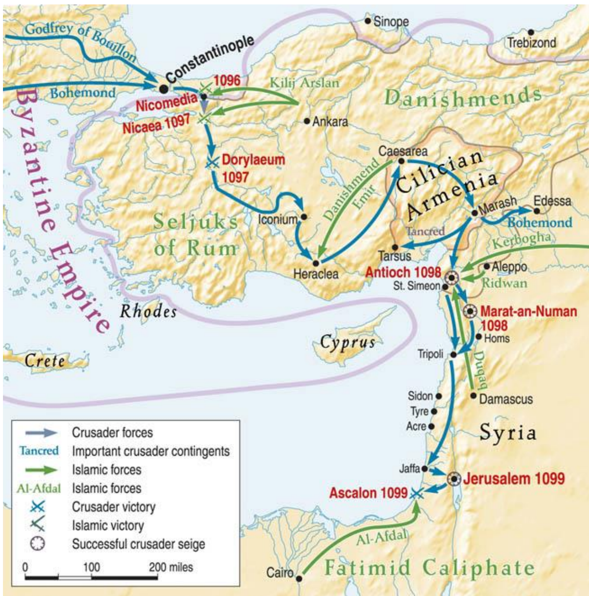
Слика 3. Битке током Првог крсташког рата 59

забринутост услед нове најезде Западњака, обзиром да су веровали да са њима неће да буде неких већих проблема. 58