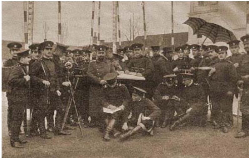
Слика 2: Питомци Војне академије на часу геодезије

Подела на два нивоа имала је посебан циљ и задатак да задовољи потребе трупе и потребе науке. Тиме је требала да се направи селекција међу официрима, чиме би најбољи могли да се усавршавају. На тај начин се образовао старешински кадар који је могао да прати развој војне науке и обликује српску војску. Војна академија је подизала општи научни ниво српске војске, чиме је стваран услов за њен напредак упоредо са другим европским војскама. Нижа школа је требала да траје три године и да се у њој стичу основна војна знања. У Нижу школу могли су се примати ђаци са најмање пет свршених гимназијских разреда, да су старости од 16 до 19 година, доброг владања и да при ступању у школу положе прописани пријемни испит. Виша школа је требало да траје три године, да даје виша знања и да се дели на три специјалистичка одељења: генералштабно, артиљеријско и инжињеријско.