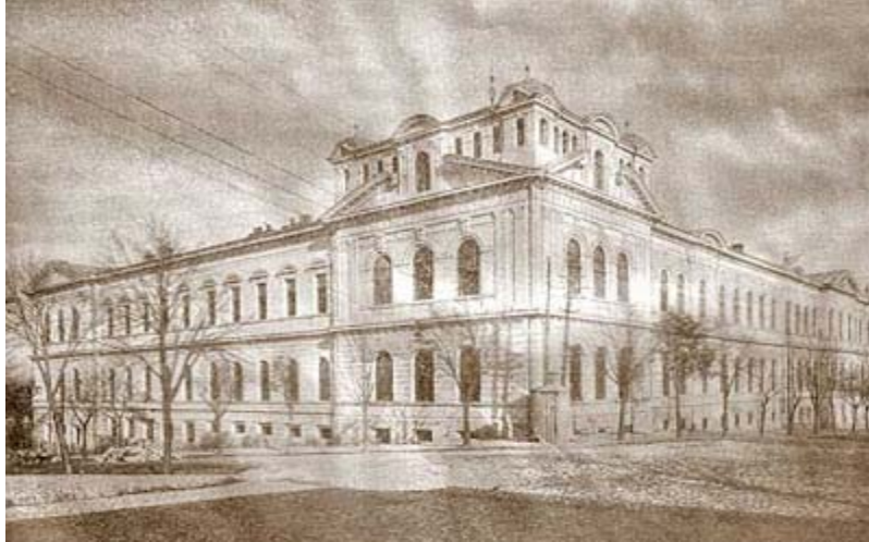
Слика 1: Зграда Војне Академије

Резервна железничка чета, Резервна минерска чета, резервна муницијска колона, резервна болничка чета, етапне болнице (према потреби), Главни интендантски воз, Главна војна пошта и Коњички депо.