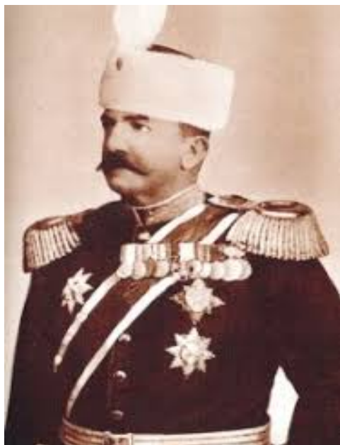
Слика 3: Краљ Милан Обреновић