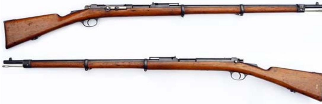
Слика 4: Пушка М 80 „Кокинка“