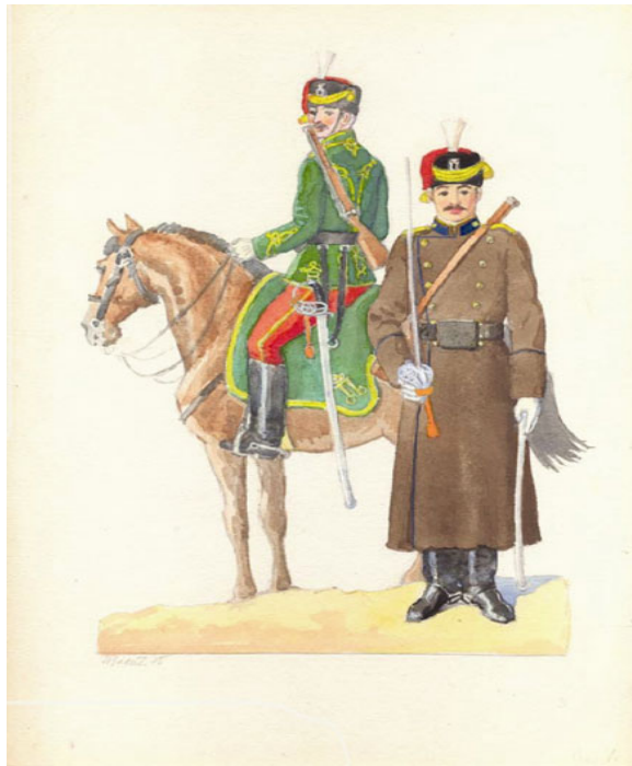
Слика 7: Униформе српске војске (илустрација)

носили су тамно плави мундир, шајкачу и блузу браон боје са усправном крагном за стајаћу војску и положеном за народну војску. После проглашења Србије за краљевину на ред је дошла и промена униформе у војсци, свакако по жељи краља Милана који се, веома интересовао за све што је у вези са војском. У то време утицај на изглед униформе српске војске имали су Аустро-Угарска, Русија и у мањој мери Француска. Почетком 1882. године донета је измена прописа из 1870. године, по којој се уводи „гуњић“ – блуза од плаве чоје, а дотадашња браон избацује и у Пропису замењује тамно плавом. Браон боја је замењена и зато што се сматрала „аустријском“ а плава боја се сматрала народном. У сваком случају, измена је следовала брзо и блуза је постала плава. Истина, питање је да ли је било времена за корениту измену мрке униформе, јер је већ крајем 1882. године донет указ о новој униформи. Она се разликовала од дотадашње али су задржани ранији основни елементи: француска капа, тамноплави мундир и сивоплаве панталоне.