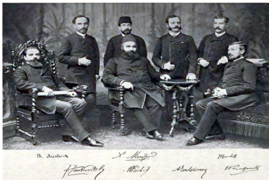
Потписници Букурешког мира 3. марта 1886. године