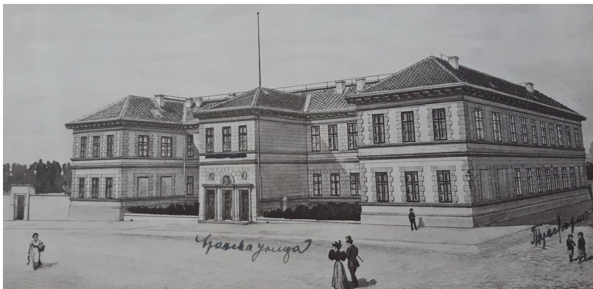
Слика 10. Зграда панчевачке Гимназије