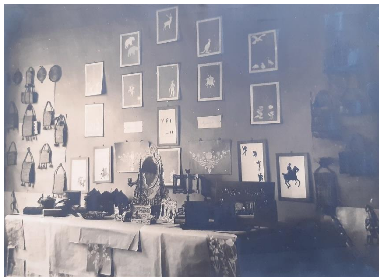
Слике 8. и 9. Изложба у Мушкој грађанској школи у Панчеву 1922. године