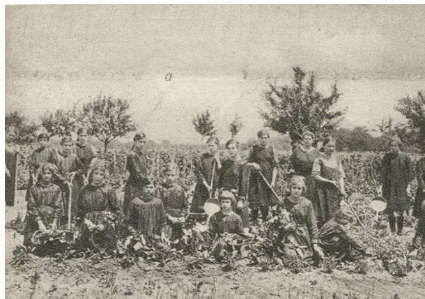
Слике 2, 3, 4. и 5. Наставнице и ученице Школе за домаћице у Панчеву испред зграде ове школе 1923. године (2), ученице ове школе уче шивење (3), у кухињи (4), уче повртарство (5)