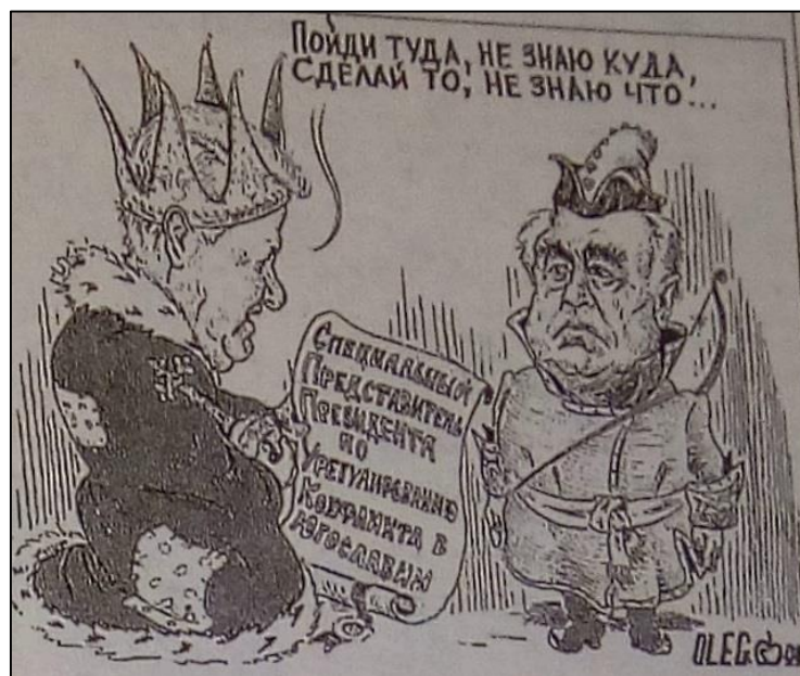
Карикатура поводом именованја Черномирдина за „специјалног представника” 321

проблема”. 319 Објављена је и карикатура на којој је Јељцин приказан у лику одрпаног цара који повељом именује Виктора Степановича за свог специјалног представника. 320