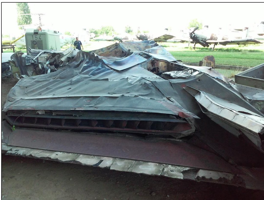
Остаци авиона Ф-117 у београдском Музеју ваздухопловства

као и да је име обореног пилота било Кен Дуел [sic]. 182 „КП” је врло могуће користила српске изворе, будући да је београдска штампа тих дана такође писала да је „Куб-М” оружје из ког је оборен Ф-117, 183 што је у недостатку информација била најзаступљенија претпоставка, будући да је поменути систем био најсавременији у поседу ПВО јединица ВЈ. И име пилота Кена Двелија, чије је презиме новинар погрешно транскрибовао на руски, такође је било присутно у српским медијима, будући да је било написано испод поклопца кабине обореног авиона. Тек касније се испоставило да је оборени пилот заправо био Дејл Зелко. Дописник „Комсомолке” И. Коц, пренео је бројне анегдоте и шале на рачун обарања америчког авиона. 184