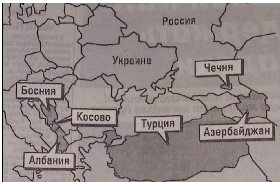
Погрешно означена позиција Косова на карти СРЈ 111

сталног дописника, као и отежаним снабдевањем провереним информацијама у време ратне конфузије и војне цензуре. Ипак, како је време пролазило, новинари „КП” били су све упућенији у проблематику, па се и број грешака смањило.