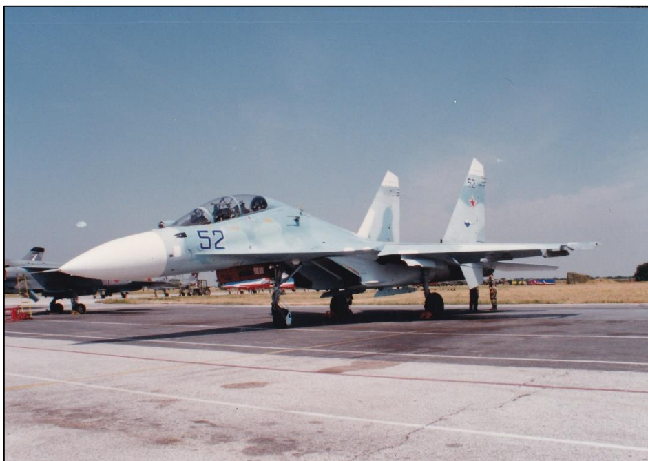
Руски Су-30 на аеромитингу у Батајници 1997. године