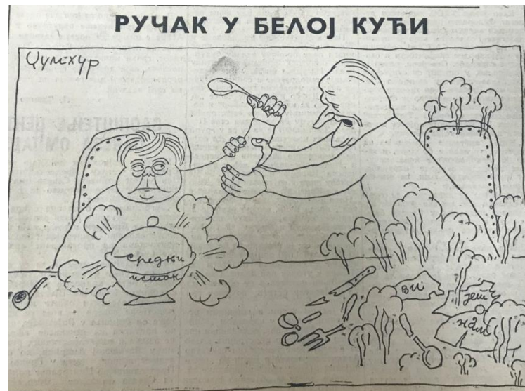
2. Карикатура, `` Ручак у Белој кући``, Политика, 4. јун 1967.