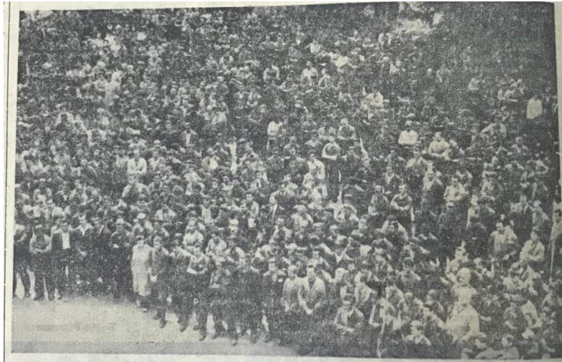
3. Протестни митинг, Политика, 7. јун 1967.