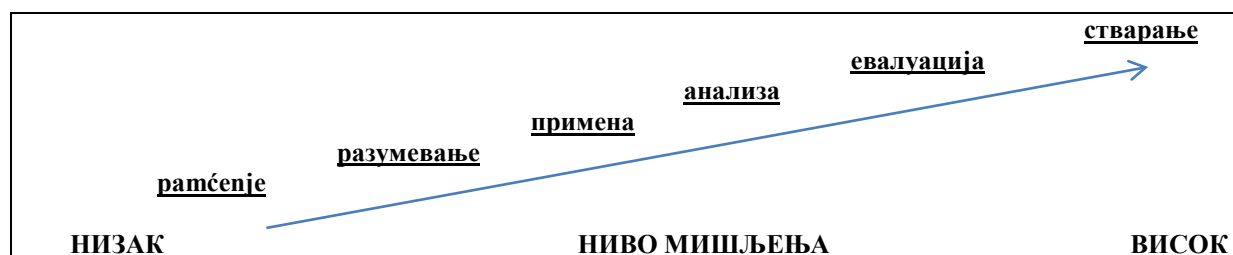
Табела 1: Питања у настави и циљеви поучавања

(Anderson 2000, prema: Crawford et al., 2005:4)