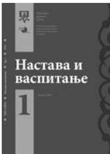
Први број часописа Настава и васпитање објављен у суиздаваштву Педагошког друштва Србије и Института за педагогију и андрагогију Филозофског факултета Универзитета у Београду