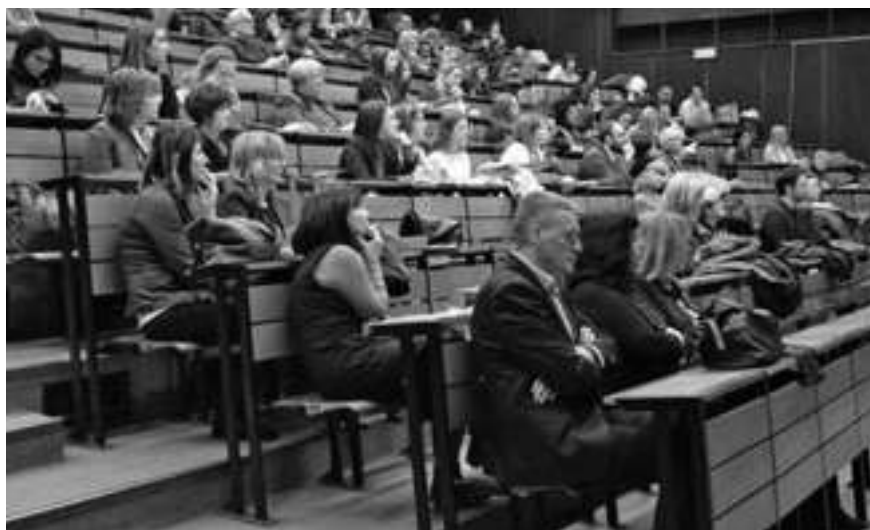
Учесници националној научној скупи Сусреши њедатоа „Образовна њолићика и њракса: у складу или у раскораку?” који је одржан 25. и 26. јануара 2019. године