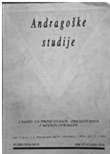
Први број часописа Андрагошке студије објављен 1994. године