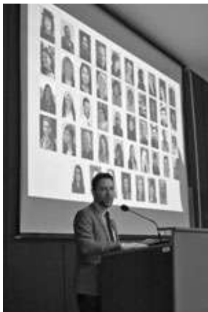
На Свечаној седници њоводом 125 година Кашегре за њедатоију одржане 14. децембра 2017. године, др Владетиа Милин у свом излајању њовори о члановима Одељења за њедатоију и андраиоију