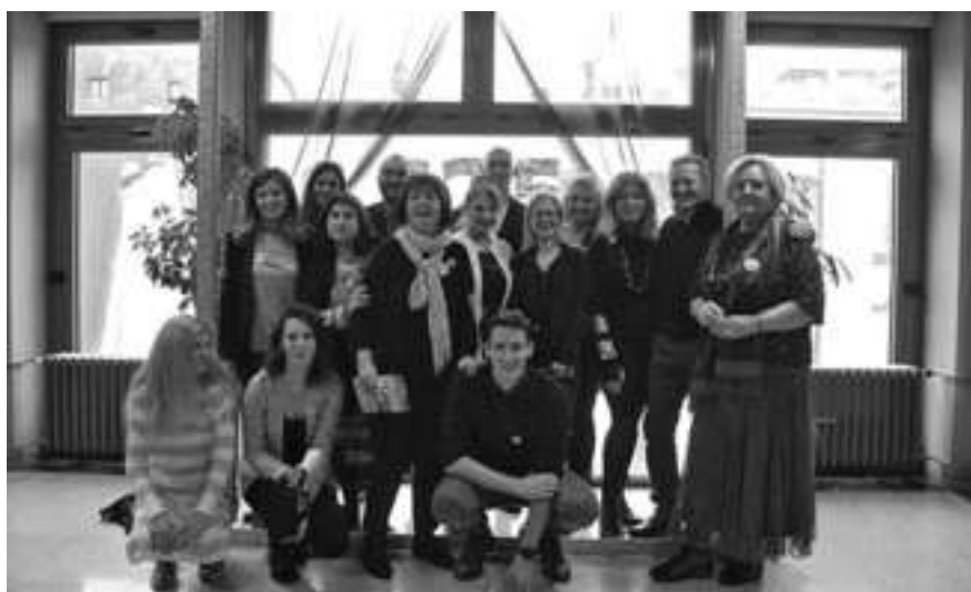
Чланови Одељења за педагогију и андрагогију на изложби поводом обележавања 125 година Католицке школе за педагогију